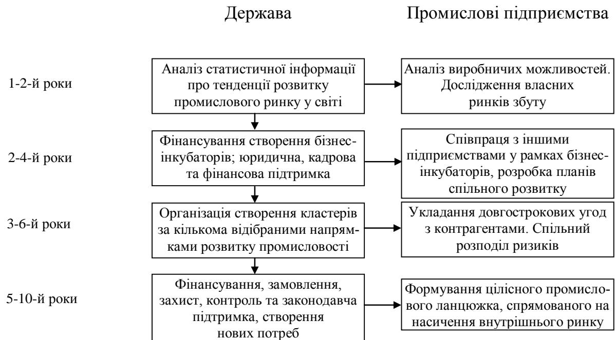
Рис. 1. Етапи створення промислових кластерів підприємств за державної підтримки

Обидва плани передбачають детальний аналіз стану промисловості України, щорічного споживання певних видів промислової продукції, аналіз тенденцій зміни споживання не лише на території країни, а й інших держав, що мали схожі проблеми у розвитку промисловості (зокрема досвід Російської Федерації). Принципи створення кластерів можна зобразити таким чином рис. 1.